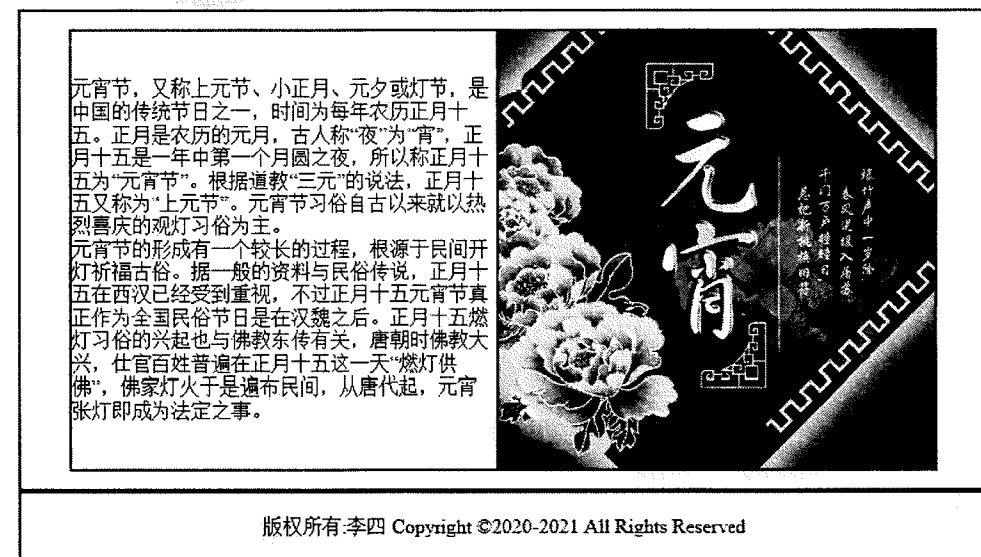
图 3 yuanxiaojie.html